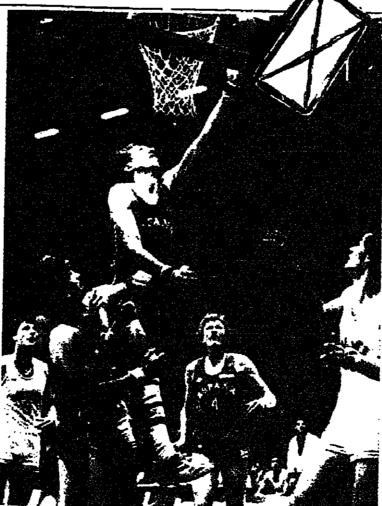
اساتيا تفوز على اسرائيل في كرة السلة ، وفي الصورة احد لاعبي الفريق الاسباني وهو يسجل احد الاهداف.